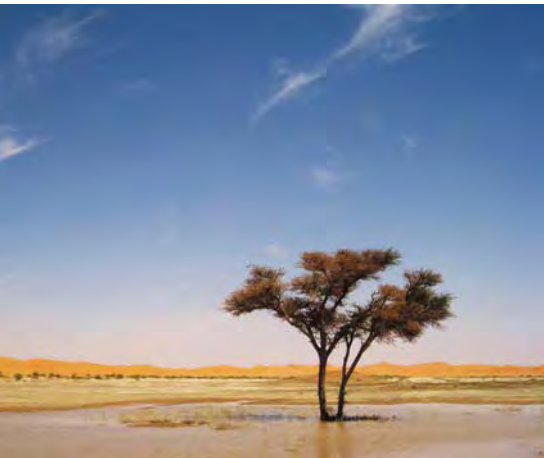
RETOUR, VERS UN POINT D'ÉQUILIBRE