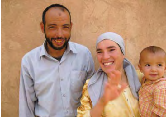
LA PÉPINIÈRE DU DÉSERT